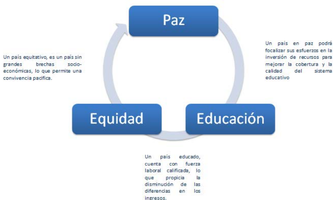
Gráfica N° 1 Pilares fundamentales Plan Nacional de Desarrollo 2014 – 2018 “Todos por un Nuevo País”

Adicionalmente, el Plan Nacional de Desarrollo “2014 – 2018 “Todos por un Nuevo País” (versión preliminar), plantean cinco (5) estrategias transversales que permitirán a este Gobierno avanzar en la construcción de un país en paz, equitativo y educado: